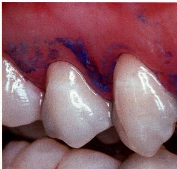
Afb. 1. Kleuring van de gingiva met Mira-2-Tone® om beschadigingen aan het orale epitheel op te sporen.

Voor de tweede sessie kregen de proefpersonen instructie om de komende 4 weken thuis 2 maal per dag gedurende 2 minuten mét tandpasta te poetsen met de handtandenborstel. Zowel een mondelinge als geschreven instructie voor het gebruik van de